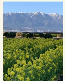
対岸から望む比良山系