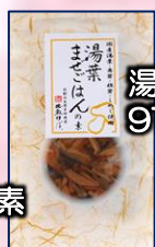
湯葉ませごはんの素 972円