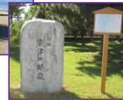
なぎさ公園の石碑