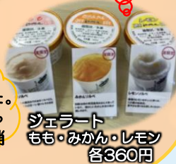
ジェラート もも・みかん・レモン 各360円