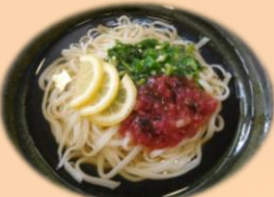
すっぱりうどん 990円