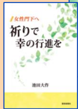
祈りで幸の行進を 730円