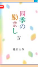
四季の励まし IV 1549円