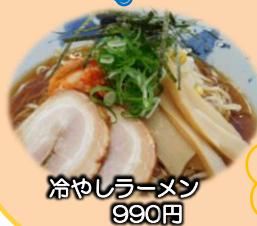
冷やしラーメン 990円