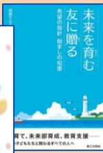
未来を育む友に贈る 990円